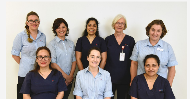
Ban Điều dưỡng Phòng Khám Gan, Bệnh viện Liverpool

Nếu được tìm thấy có Viêm gan B hoặc C, quý vị sẽ được Bác sĩ gia đình hoặc một trong các Y tá tại Phòng Khám Gan của chúng tôi cho biết. Thông thường, việc chẩn đoán cần làm thêm các xét nghiệm khác và chúng tôi có thể giúp quý vị trong việc chăm sóc và điều trị.