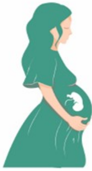
Truyền từ mẹ sang con