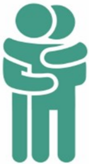
Tình dục không có sự bảo vệ