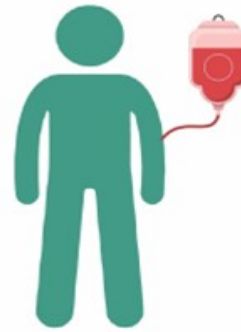
Truyền bệnh do tai nạn kể cả truyền máu và cấy ghép cơ phận nhiễm bệnh