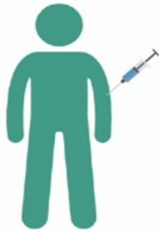
Sự can thiệp y khoa không tiệt trùng; thủ tục y khoa tại các nước đang phát triển; và tiêm chích ma túy