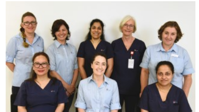
利物浦医院肝肾脏诊所护理团队 (Liver Clinic Nursing Team, Liverpool Hospital)

如果检查发现你患有乙型肝炎或丙型肝炎，你的全科医生或我们肝脏诊所的护士会通知你检查结果。通常需要进一步检查以进行诊断，我们可以提供治疗和护理。